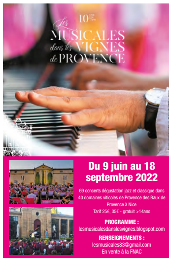
Quart de page 82 mm X 125 mm