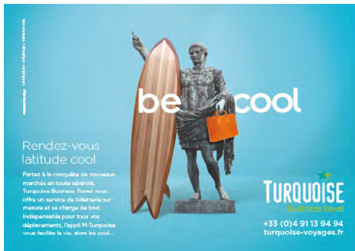
Demi-page 175 mm X 125 mm